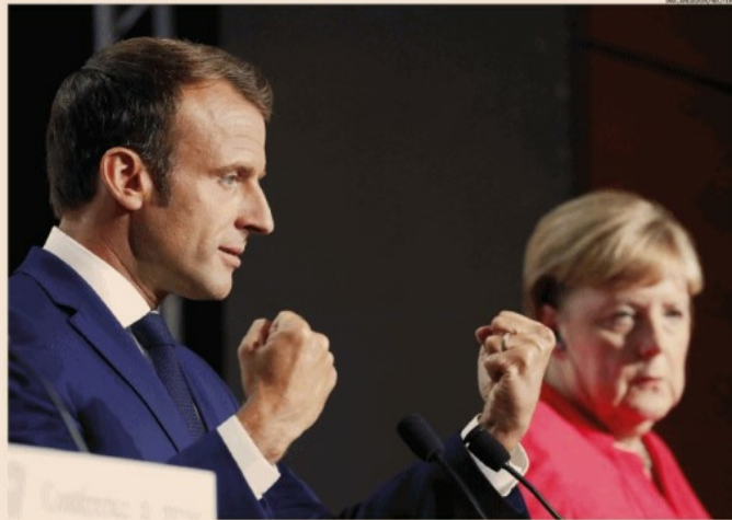
La forza della Francia. Il presidente francese Emmanuel Macron con Angela Merkel, capo del governo tedesco