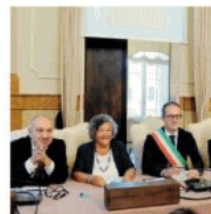
Il Consiglio straordinario